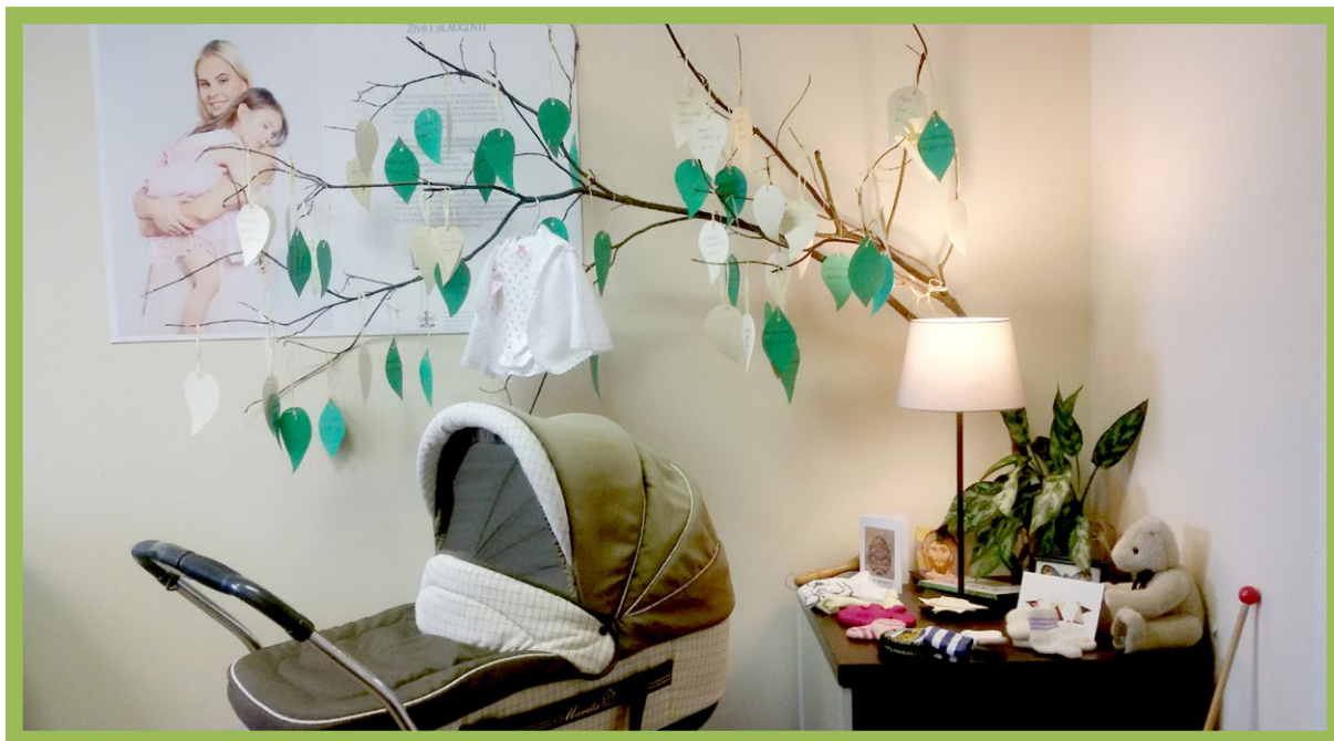
Ant Gyvybės medžio jau 50 lapelių - gimusių vaikelių.

Žinome, kad per metus gimė 27 kūdikiai mūsų centre konsultuotoms moterims, dalis moterų dar laukiasi.